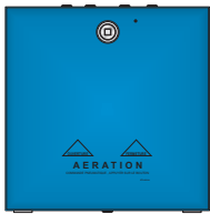
Modèle avec portillon PLEIN Porte fermée