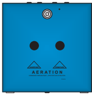
Modèle avec portillon à TROUS Porte fermée