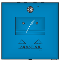
Modèle avec portillon VITRÉ Porte fermée